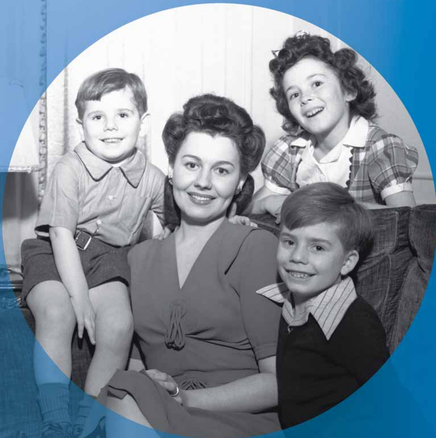
1940 Enpresen lehenengo aseguru kolektiboak